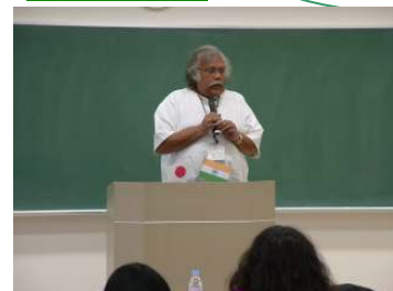
ネルー大学 芸術・美術学部長