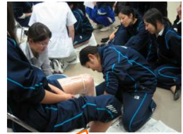
真剣なまなざしの学生たち

スライドや机上だけでは理解できなかったことが、専門的な講義や実技により、学生一人ひとりの気持ちの中で、今後の授業に活かされていくことと思います。