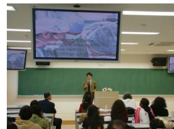
古井教授の英語での説明